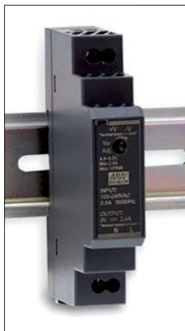
Obr. 1. Patnáctiwattový model DC/DC měniče na lištu DIN

S přibývajícím počtem prvků automatizace v průmyslu i domácnostech roste také potřeba vhodné a spolehlivé napájet elektroniku, snímače, řídicí, zálohovací nebo ochranné systémy obvykle napájené malým napětím, popř. s požadavkem na galvanické oddělení od hlavní napájecí větve.