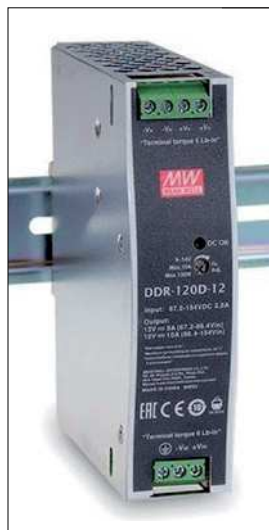
Obr. 2. Stodvacetiwattový typ DDR DC/DC zdroje na lištu DIN

DIN rozváděčů TS-35/7.5 (15). Mezi hlavní parametry MEAN WELL typů DDR na lištu DIN patří široký vstupní rozsah, široké rozmezí pracovních teplot, zesílená konstrukce izolace 4 000 V DC (vstup-výstup) a díky robustnímu obvodovému řešení i prodloužená