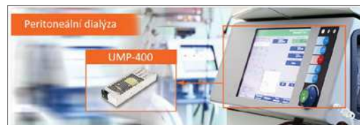
Obr. 3. Příklad aplikace modulárního zdroje UMP-400

UMP-400 modulární spínaný zdroj je schopen provozu v nadmořské výšce až 5 000 m, plnění nejnovější normy pro bezpečnost EN62368-1 bylo ověřeno nezávislým certifikačním orgánem Dekra. Příznivé rozměry UMP řady zdrojů 250 × 89 × 37 mm (d × š × v) minimalizují potřebný prostor, tichý chod umožňuje instalaci bez rušivých vlivů na osoby nebo jiné komfortní zóny. Kva-