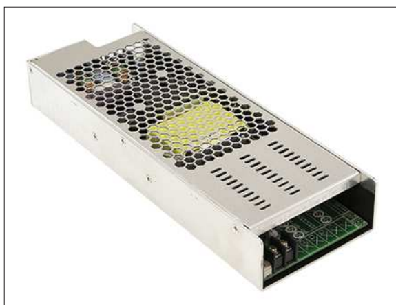
Obr. 1. Modulární vícehladinový zdroj UMP-400

Mezi hlavní přednosti UMP-400, kromě tichého chodu, patří malé rozměry a modulární řešení umožňující konfiguraci výstupních parametrů. Koncepte zdroje je čtyřkanalová, přičemž jeden (hlavní) kanál je pevně nastaven na hladinu 24 V (UMP-400-24), resp. 48 V (UMP-400-48). Tři kanály je možné osadit zásuvnými moduly, podobně jako lze v PC instalovat moduly RAM, PCIe atd. Moduly pro UMP-400 topologie DC/DC s výkonem od 35 do 100 W jsou k dispozici v mnoha varian-