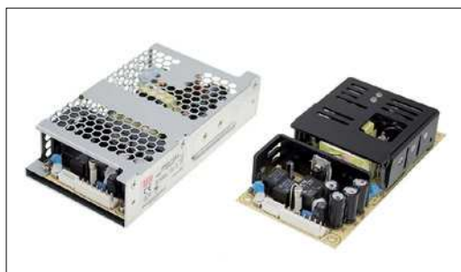
Obr. 2. Napájecí zdroj série PSC

ní přítomnosti síťového napětí a stavu baterie signalizující poruchy je možná pro typy AD-55, ADD-55. Zdroje řady AD mají zabudovanou ochranu proti hlubokému vybití akumulátoru, díky šetrnému chování tím