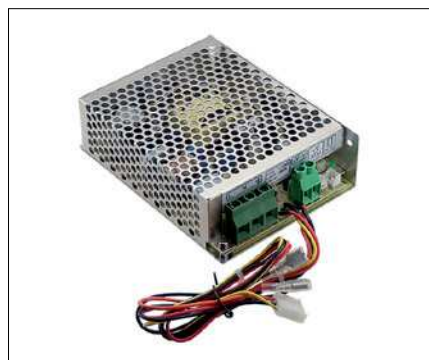
Obr. 1. Napájecí zdroj série SCP

přepnutí na napájení zátěže z akumulátoru. Po obnovení dodávky ze sítě automaticky napájí zátěž a zároveň dobíjí záložní akumulátory s napětím 12, 24 nebo 48 V (AD-155C). Varianta s označením ADD je vybavena přídatnou větví +5 V pro napájení případné podpůrné elektroniky. Volitelná funkce sledová-